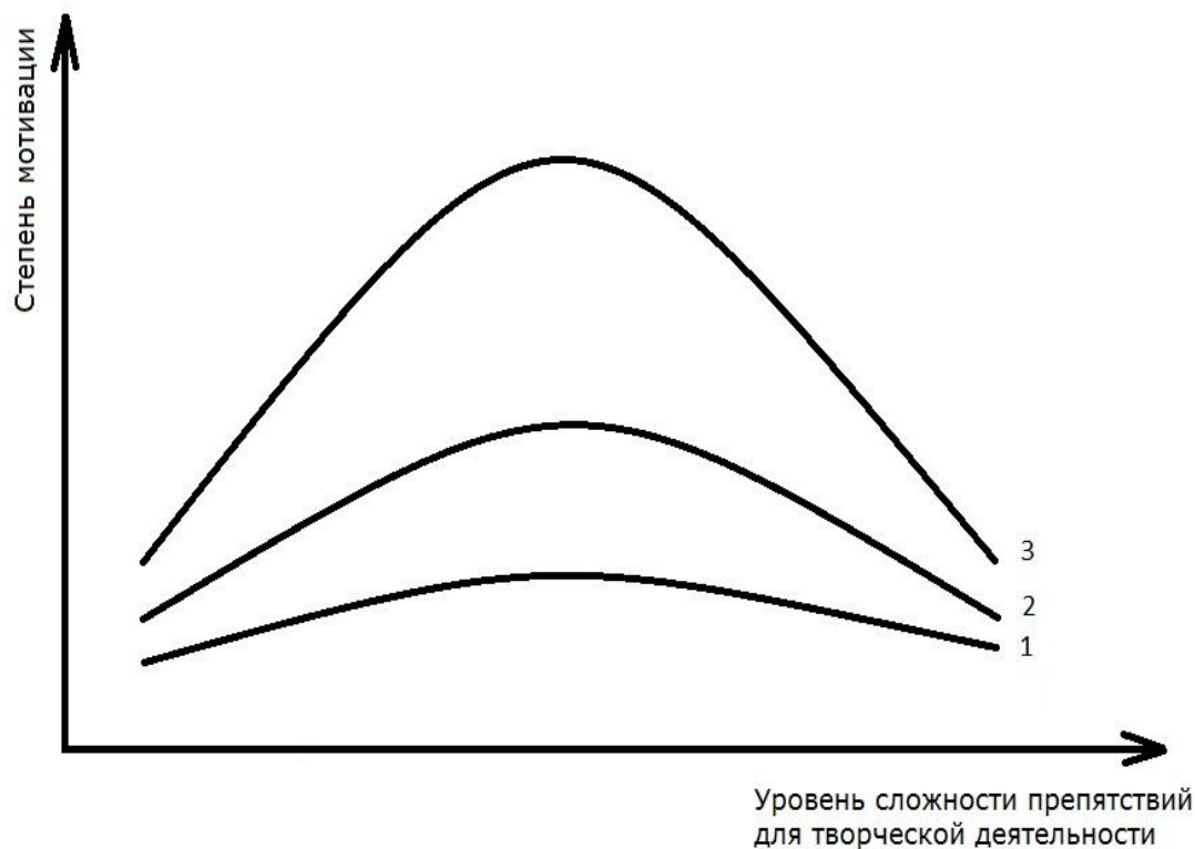
Рис 1. Значение мотивации.

творческом, интересном коллективе, для самоутверждения и т.д. Но все это не входит в задачу группы. Она формируется для того, чтобы осуществлять поиски новых решений и обязательно достичь успеха. Участники со слабой мотивацией при определенном напряжении, трудностях растормаживаются, а это значительно снижает эффективность работы группы (см. рис. 1).